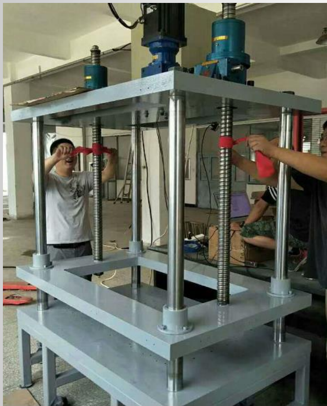
高铁散热器自动叠片机