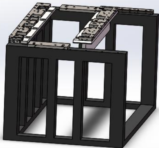
加工机械工装夹具